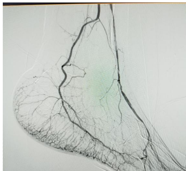
Рис. 2. Та же больная после проведения реканализации и баллонной ангиопластики. Полное восстановление кровотока по ПББА, ЗББА и артериям стопы

Для реканализации бедренно-подколенного сегмента и артерий голени использовали проводник 0,14 Comrad (Abbot), и баллоны различных размеров NanoCross Elit и Admiral Xtreme (Medtronic). Стентирование бедренно-подколенного сегмента осуществлялось стентами фирмы Cordis.