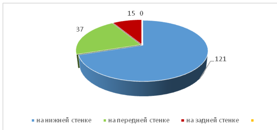
Рис. 1. Локализация кисты в верхнечелюстном синусе