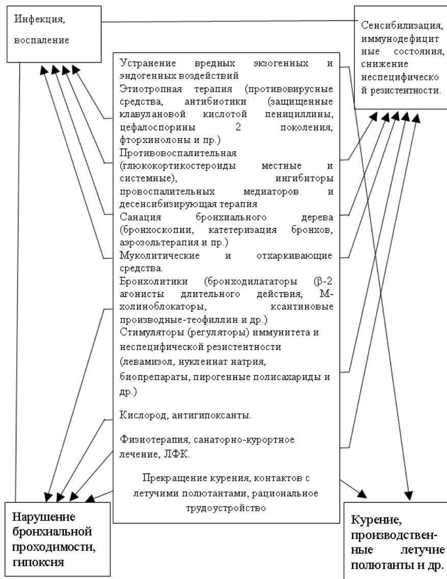
Рис. 1. Принципиальная схема этио-патогенетического лечения хронического бронхита

Эти больные в практической деятельности врача выделяются в особую группу «часто, длительно болеющие» (ЧДБ). Раскрытие индивидуальных особенностей генеза их болезни невозможно без специального вирусологического исследования уже на сравнительно ранних этапах ХБ II-III, оно включает brush-биопсию слизистой носа и бронхов, исследование парных сывороток в серологической реакции (ПЦР, ИФА, ИХЛА) и др. У этих больных мы нередко выявляли персистенцию вирусов гриппа «А» и парагриппа, а также снижение функциональных показателей клеточного звена иммунитета, что объяснялось супрессивным влиянием вирусной инфекции. Включение в комплекс лекарственной терапии этих больных противовирусных и иммуоактивных препаратов (ремантадин, интерферон, интерлок и др.) позволяет в большинстве случаев улучшить их состояние и восстановить работоспособность, т.е. является основной лечебно-профилактической мерой в их диспансерном наблюдении.