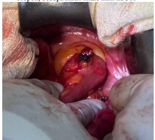
Рис. 12. Формирование сигмо-ректального анастомоза конец-бок (ниже уровня импланта)