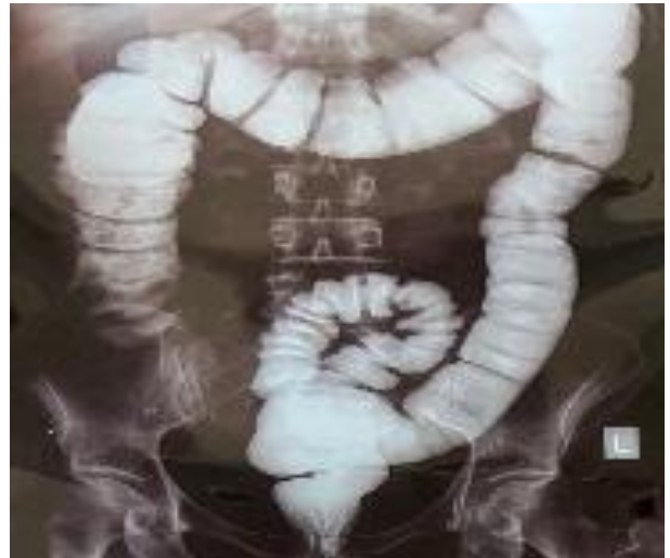
Рис. 2. Ирригография. Долихосигма. Дискинезия по смешанному типу. Выпадение прямой кишки