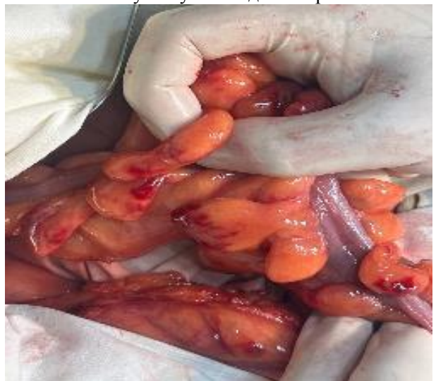
Рис. 4. Иссечение сосудов и брыжейки сигмовидной кишки с целью мобилизации. Открывается окно над крестцовой костью обходя сосуды и мочеточники для укрепления дна сетчатого имплантата