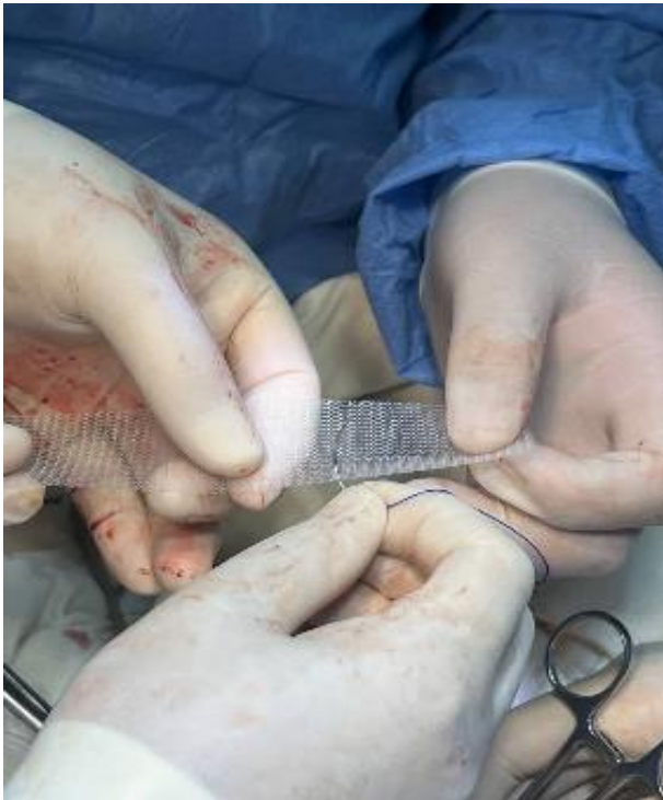
Рис. 9. Сеточный имплантат фиксируется к пресакральной области 2 швами (Монофил 1-0)