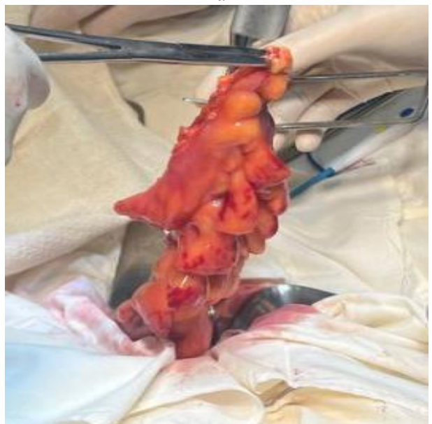
Рис. 6. Мобилизованная сигмовидная кишка резецируется с двух сторон.