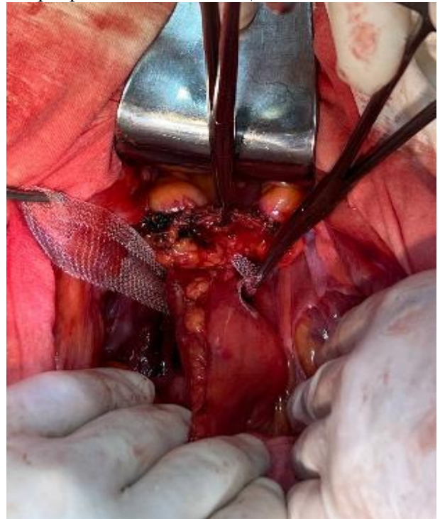
Рис. 10. Сеточный имплант фиксируется с двух сторон, обворачивая кишечник на 360°