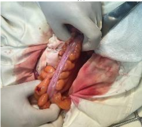
Рис. 3. Вскрытие брюшной полости и выделение сигмовидной кишки