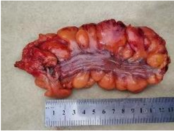
Рис. 7. Резецированная сигмовидная кишка