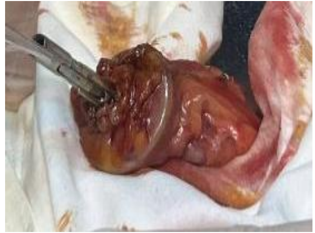
Рис. 8. К проксимальной части сигмовидной кишки прикрепляется головка ЦСА с кيسетным швом