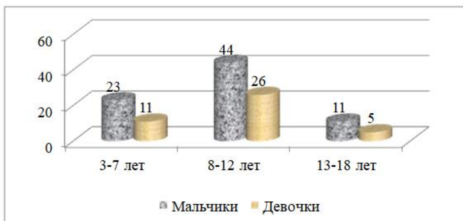
Рис. 2. Распределение детей, инфицированных инфекционным мононуклеозом, по возрасту и полу